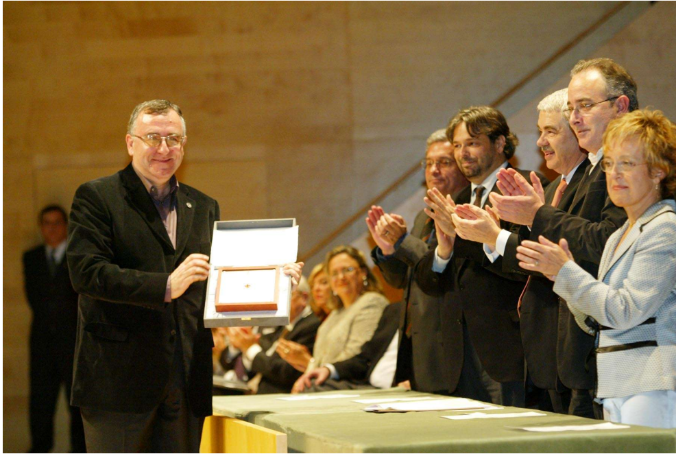
Auditori Barcelona 14/XII/2004