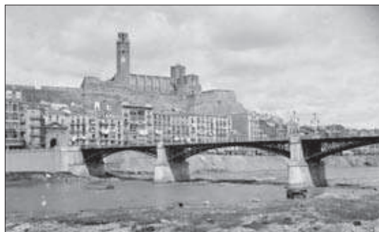
Imatge dels anys 20