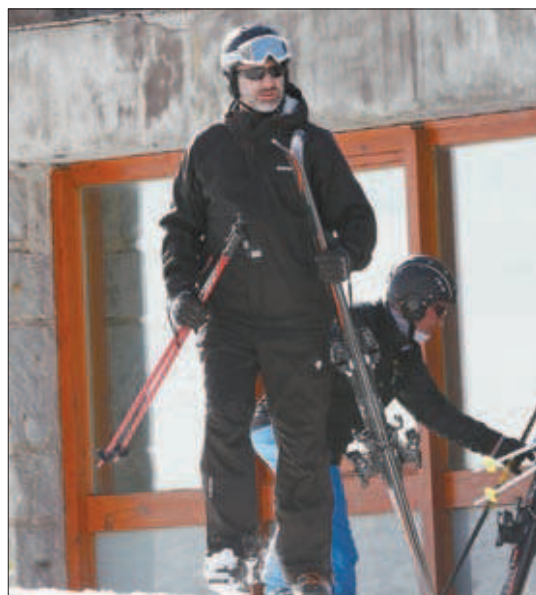
El rei Felipe VI, ahir a Baqueira Beret

la Neu. Llavors es va desplaçar a Formigal després d'assistir a Jaca a la final del Campionat del Món sub-20 d'hoquei sobre gel, divisió II, disputada entre les seleccions de Corea de Sud i Espanya. Letizia i les seves filles, les infantes Eleonor i Sofia, no es van unir en aquella ocasió al llavors hereu de la Corona espanyola, que va practicar aquest esport en companyia d'uns amics.