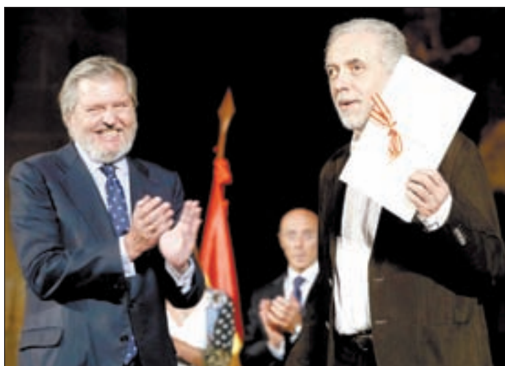
Trueba recibió ayer el Premio Nacional de Cinematografía

Además de las películas, el canal emitirá documentales y espacios de producción propia como El Imperio de los Fans o Star Wars Celebration que también se podrán ver en vídeo bajo demanda.