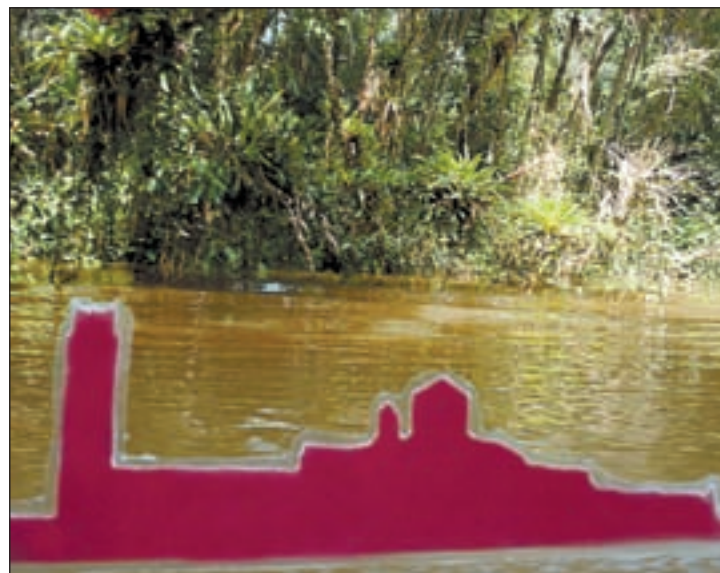
La Seu Vella al riu Cuyabeno