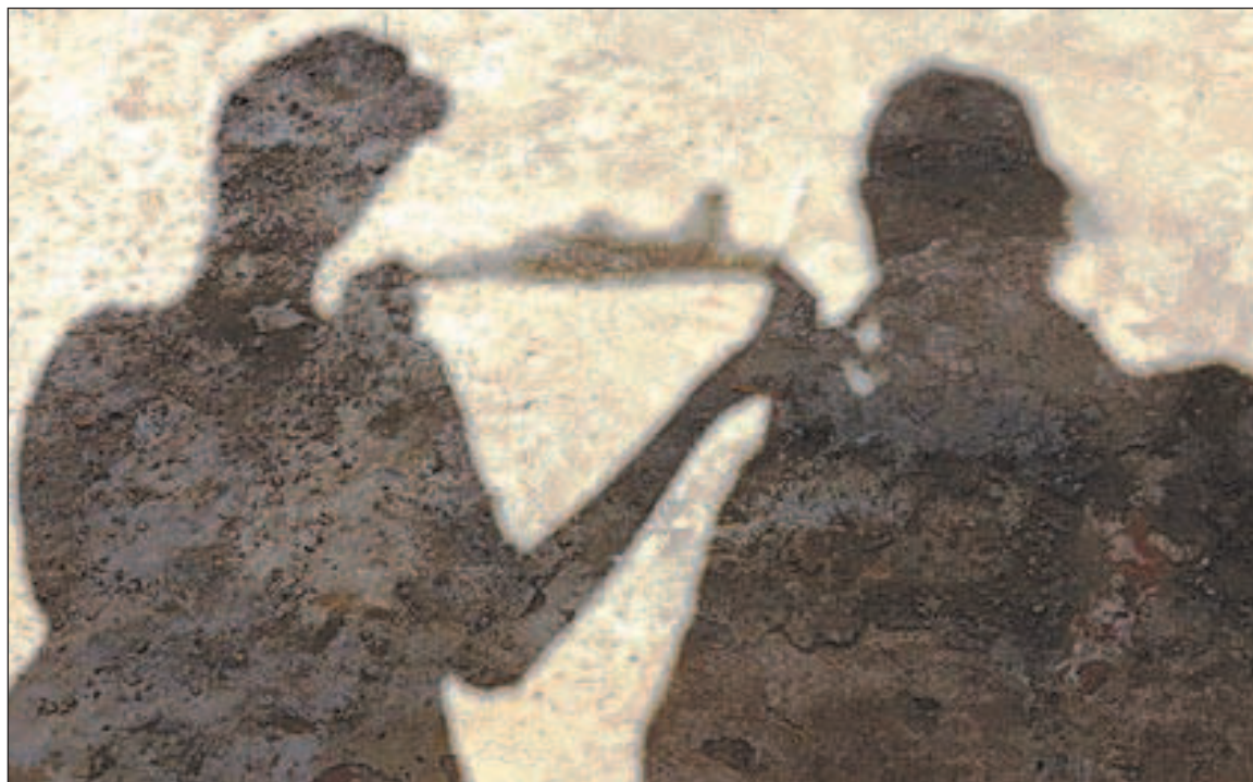
Les nostres ombres / amb la silueta de la Seu Vella que hem passejat pel món a les mans

Hem entrevistat a 74 persones de 30 nacionalitats diferents, tant viatgers, també, com nadius dels llocs que hem visitat. Totes han sigut persones que han significat