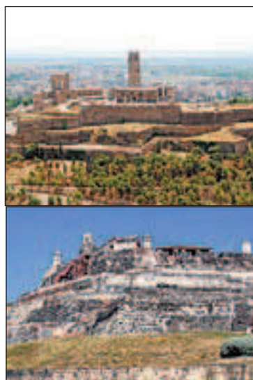
Comparables? / Molts dels entrevistats ens han dit que el Turó de la Seu Vella de Lleida (a dalt) els recordava el de San Felipe de Barajas a la colombiana Cartagena de Indias (abaix)

El claustre és l'altre element que molts destaquen, i tots els entrevistats coincideixen en copsar la rica història que ha d'haver en tant bell monument. Alguns indiquen la barbàrie humana, que ha fet tant de mal al llarg dels temps,